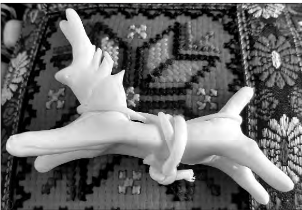
Знаменитий сирний коник.