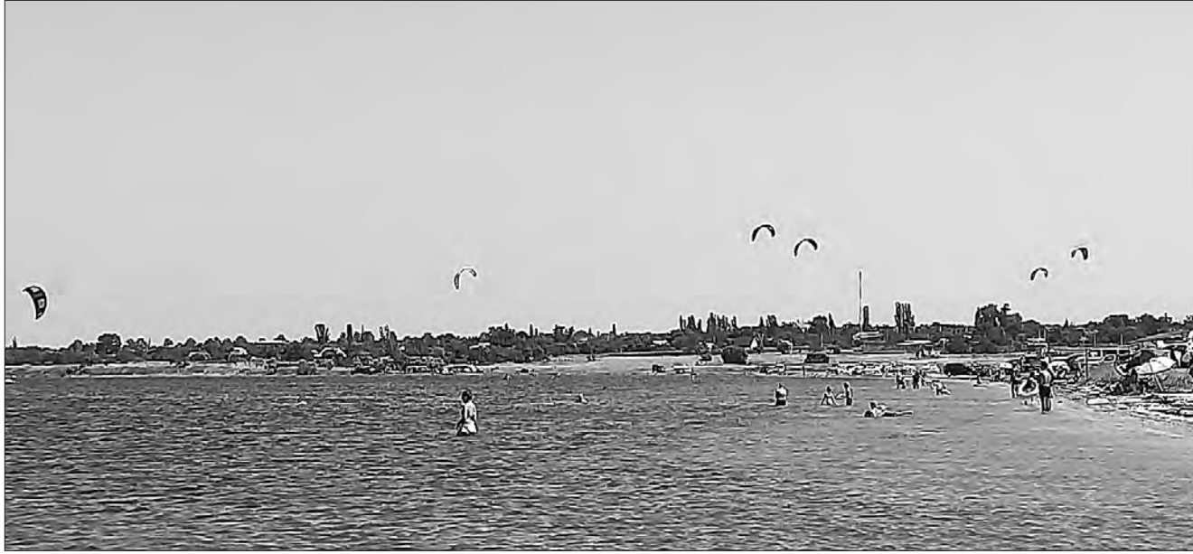
Місцевість обирають любителі екстремальних видів спорту.

лівка, Ташине Коблевської сільської тергромади Миколаївського району.