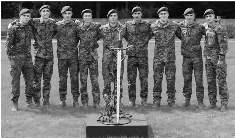
Фото зі сторінок Житомирського військового інституту імені С. П. Корольова у Фейсбуці.