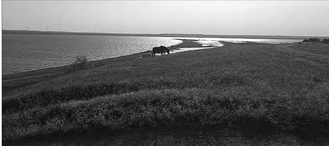
Лиман вражає своїми краєвидами.

Своє обурення з приводу незаконних дій керівництва парку «Тилігульський» висловив відомий україн-